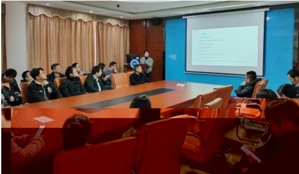
图 员工专业技 培