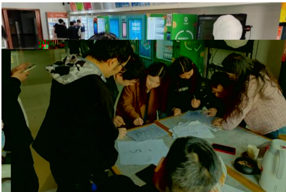
图 卓 团 建 共