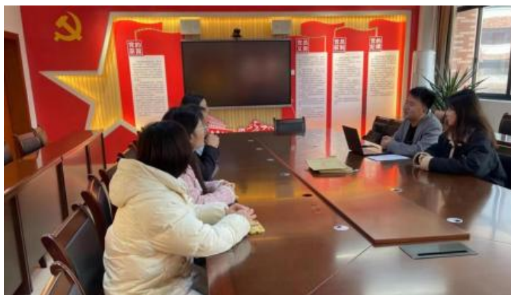
图 4-1 企开展学术 交 会