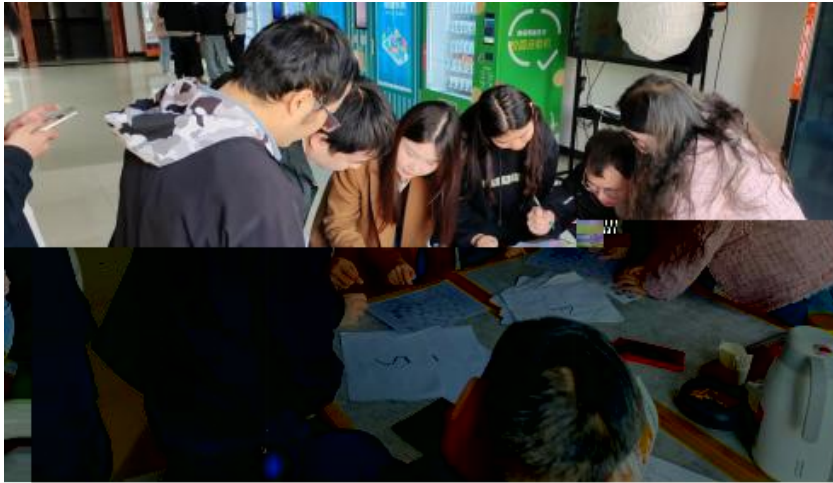
图 卓越团队建设共识营